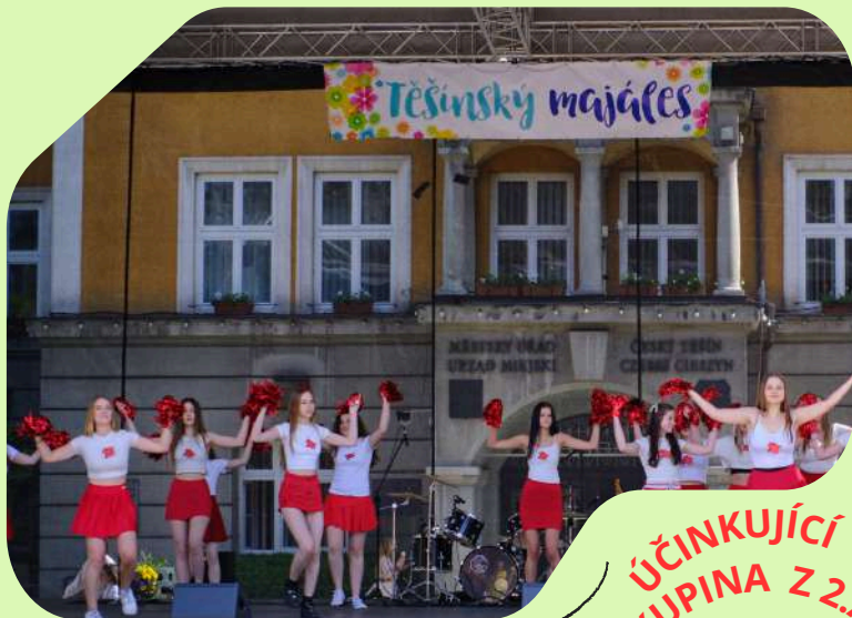
ÚČINKUJÍCÍ SKUPINA Z 2.A

"Když průvod dorazil na náměstí, čekalo na ně slavnostně vyzdobené pódium a starosta města, který studentům předá symbolický klíč od města. Královna skrálém tímto získají na jeden den nadvládu nad Českým Těšínem.